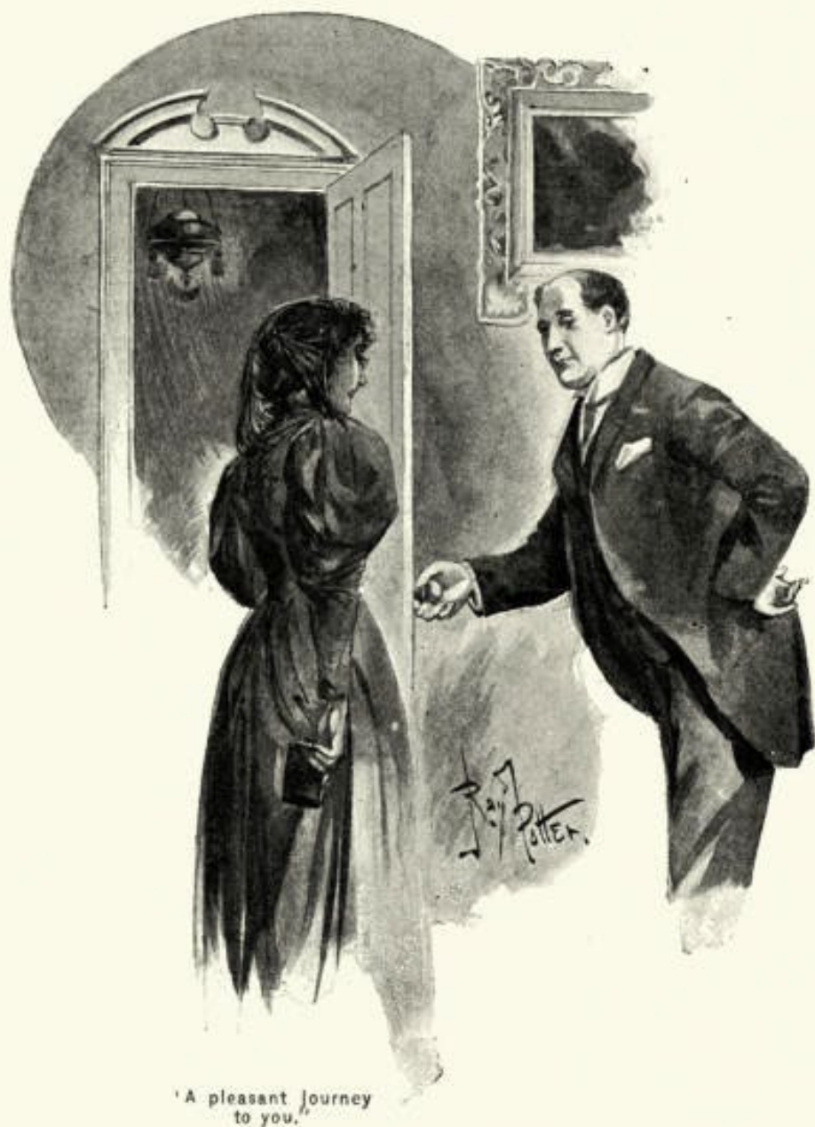
'A pleasant Journey to you.'