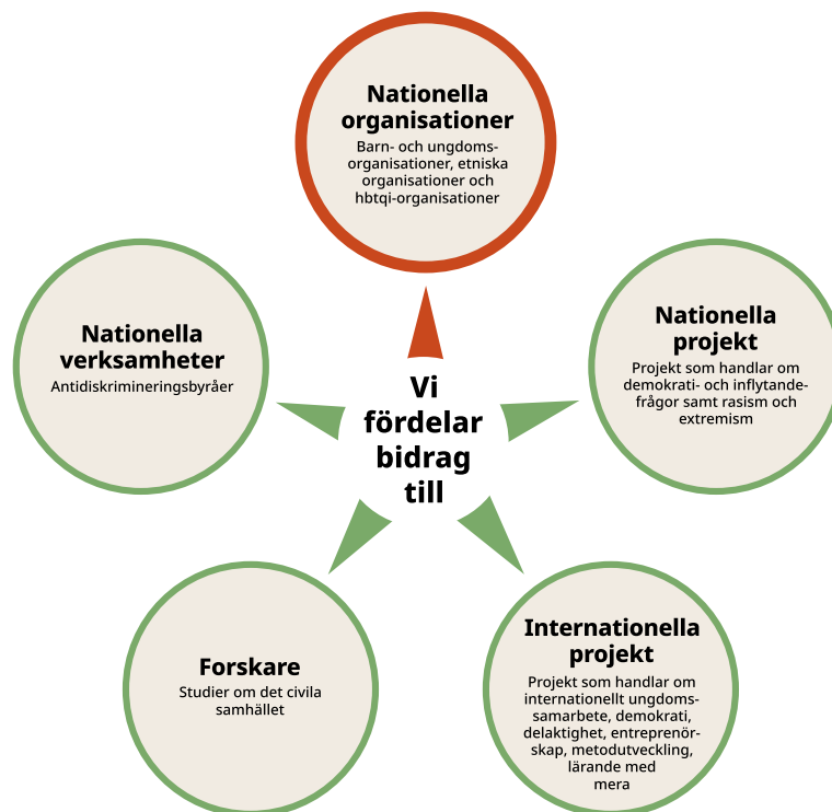
Figur 1.1 Illustration över de olika bidrag som myndigheten fördelar.

Myndigheten för ungdoms- och civilsamhällsfrågor, MUCF, är en statlig myndighet som tar fram kunskap om ungas levnadsvillkor och om det civila samhällets förutsättningar. En av kärnuppgifterna är att fördela bidrag till föreningsliv, internationellt samarbete, kommuner och forskning. MUCF fördelar bidrag till organisationer genom organisationsbidrag, projektbidrag och verksamhetsbidrag.