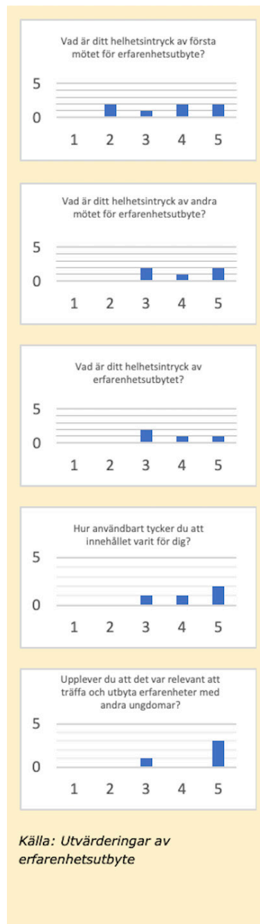
Figur 2. Enkätutvärdering digitalt erfarenhetsutbyte 2020. Antal samt värde på svarsskala 1–5. 1 representerar ett lågt värde och 5 ett högt värde.

Under andra och tredje träffen diskuterades syftet och målet med erfarenhetsutbytet samt om och hur organisationerna skulle kunna samarbeta. Sammanfattningsvis framkom att det är positivt att träffas men att det kan vara svårt att ha en dialog. Även om de är nationella minoriteter så skiljer sig förutsättningarna och möjligheterna för de olika grupperna åt. Sáminourra påpekade att samerna inte bara är en nationell minoritet utan också en ursprungsbefolkning. Det finns dock vissa frågor de skulle kunna samarbeta kring,